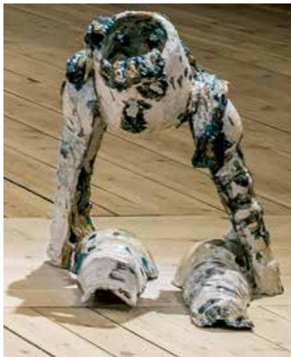
Veronica Brovall, Man Drawer , installation, glacerad keramik, lackerat eller pulverlackerat stål och aluminium. 2018/2019. Detalj.