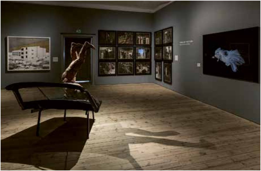
Bild från utställningen.