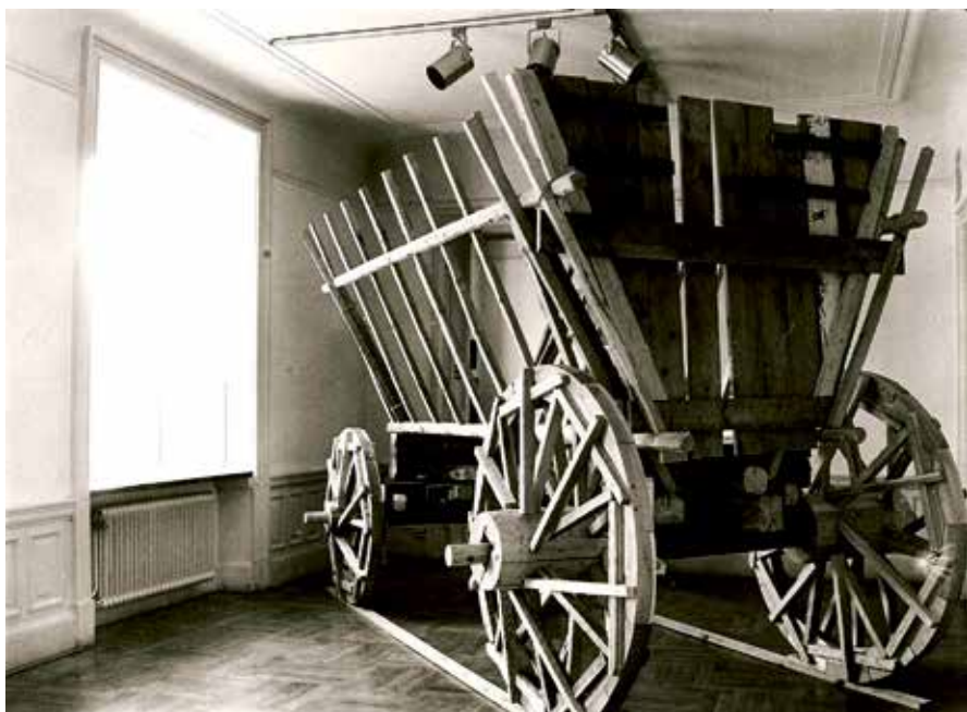
Ingolf Kaiser; Vagn för flyende , skulptur i trä, 1982.