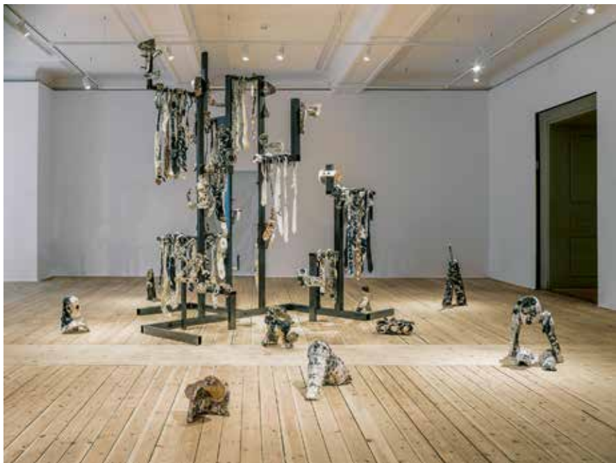
Veronica Brovall, Man Drawer , installation, glaserad keramik, lackerat eller pulverlackerat stål. 2018/2019