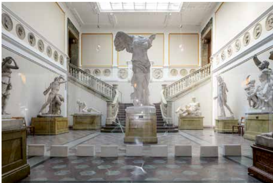
Mourad Kouri, To draw a line , 2018, acrylic glass, concrete. Konstakademien, Stockholm.