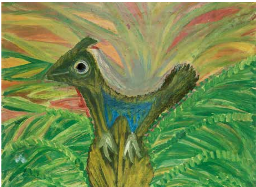
Anselm Boix-Vives, beskuren bild.