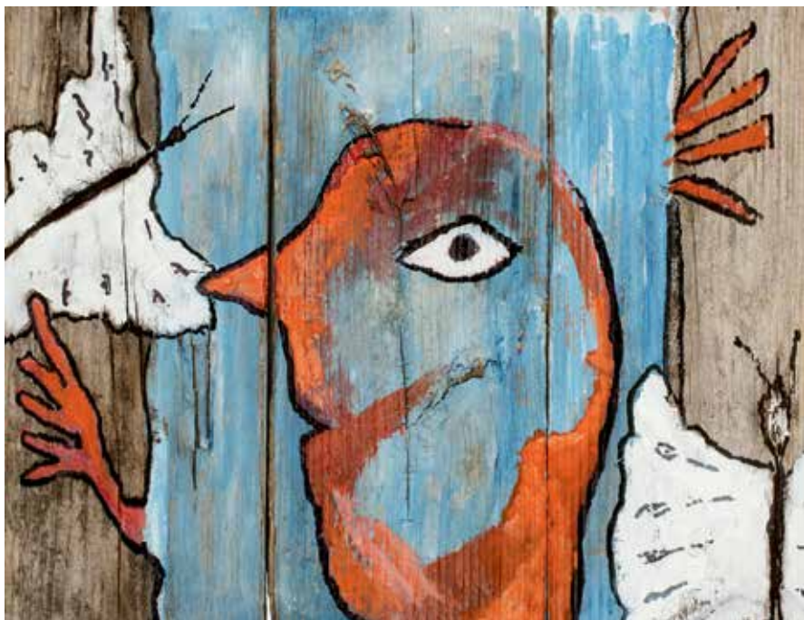
Staffan Westerberg, Servettfjärilar av smuts från röd djävul , akryl på trä, beskuren bild.

Projektrum för kortare utställningar och experiment