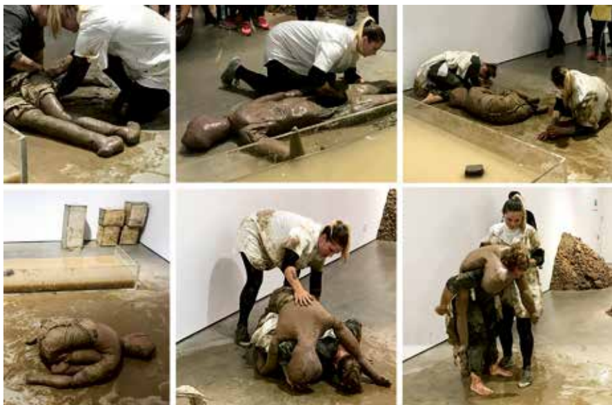
Éva Mag, Stand Up, I Said Stand Up , Bonniers konsthall 2018.