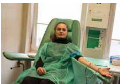
Franciszek Orlowski, This Blood is for You.

Få saker väcker så laddade känslor som blod – lidande, blodsband, extas. Föreställ dig en gåva tänkt till en anonym mottagare. I performanceverket This Blood is for You har konstnären frågat migranter, människor av olika nationell bakgrund, om de kan tänka sig att ge blod till den svenska blodbanken. Gåvotillfället registreras genom ett fotografi. Lagen ger full anonymitet mellan donator och mottagare. Här finns endast gåvan – bortom nationalitet, etnicitet, ursprung eller hudfärg – och viljan att rädda liv. Under helgen visas fotografierna och som öppning sker en delegerad performance med deltagarna i verket.