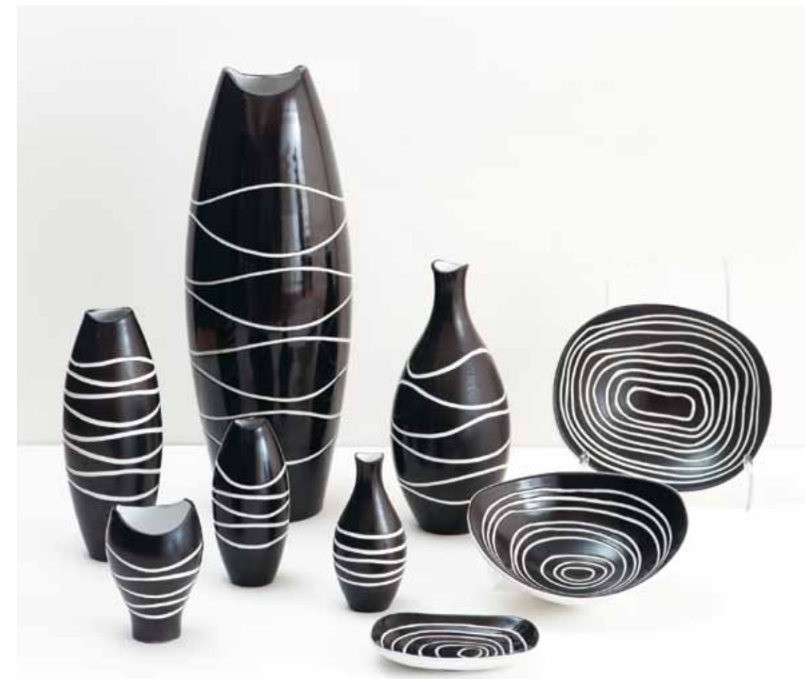
Atoll , Upsala-Ekeby, 1956-58

Hjördis föremål var enligt Upsala-Ekebys säljare de mest lättsålda under 50-talet, vilket är imponerande med tanke på att det var Upsala-Ekebys storhetstid.