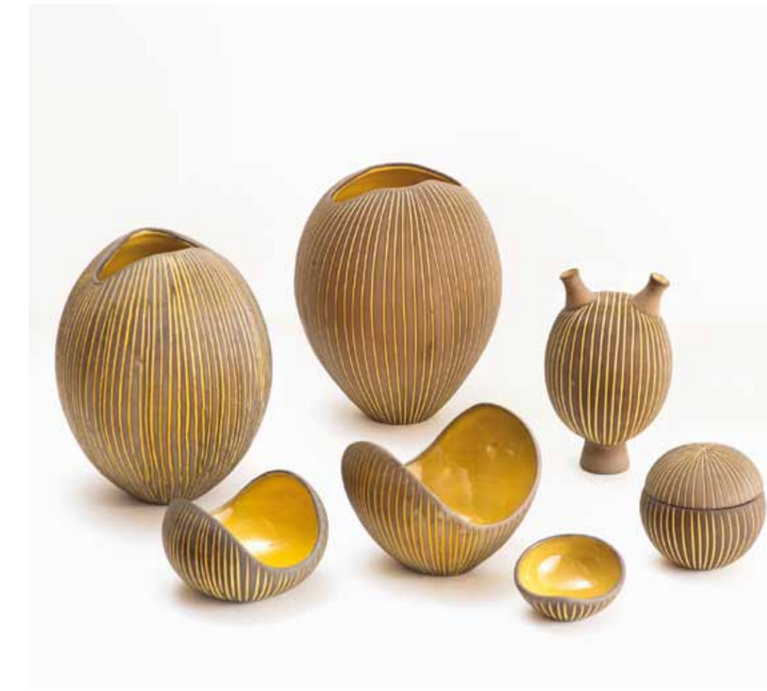
Kokos , Upsala-Ekeby, 1954-58