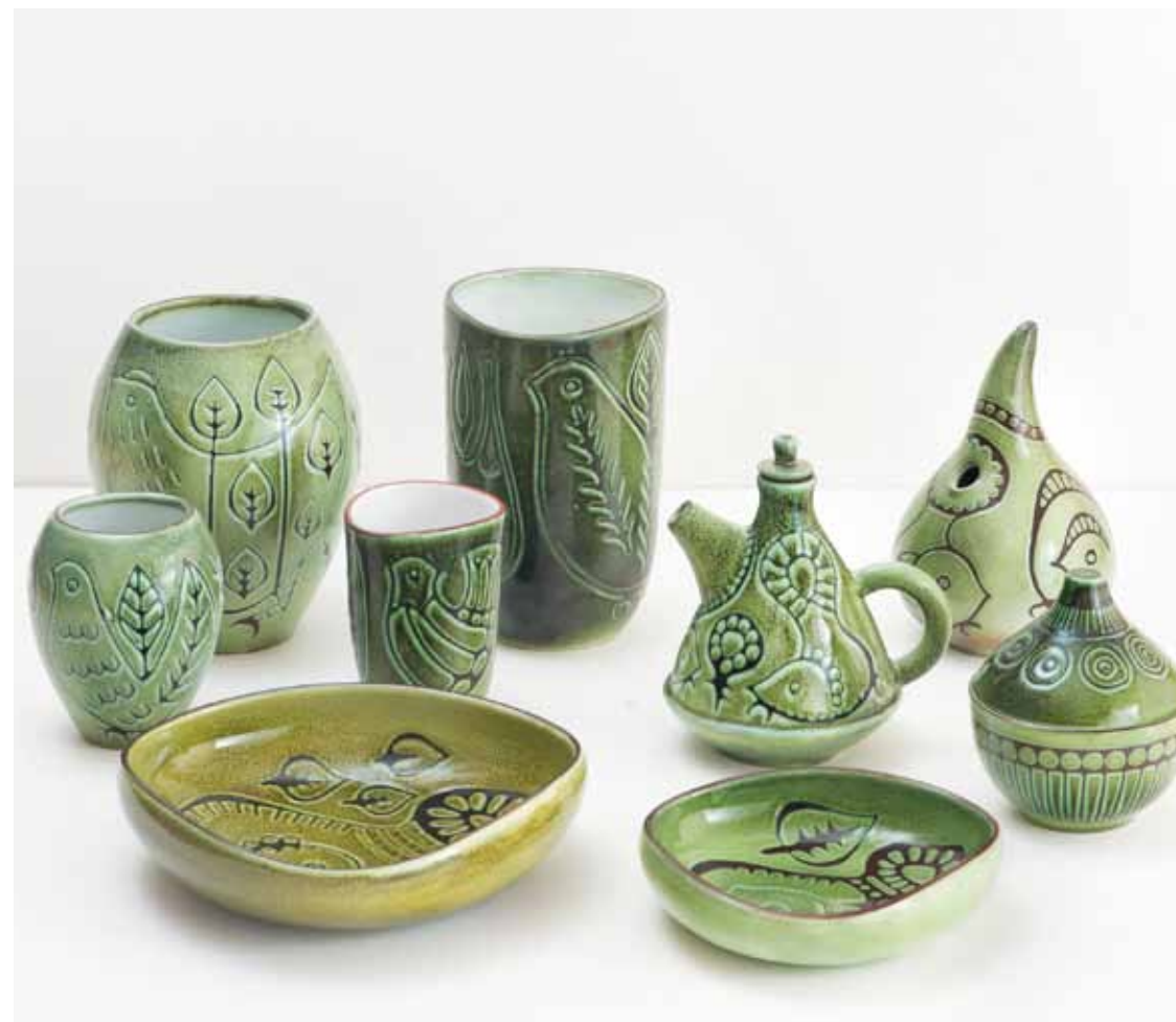
Ovan: Java , Upsala-Ekeby, 1953 Omslag: Palma , Upsala-Ekeby, 1958-60