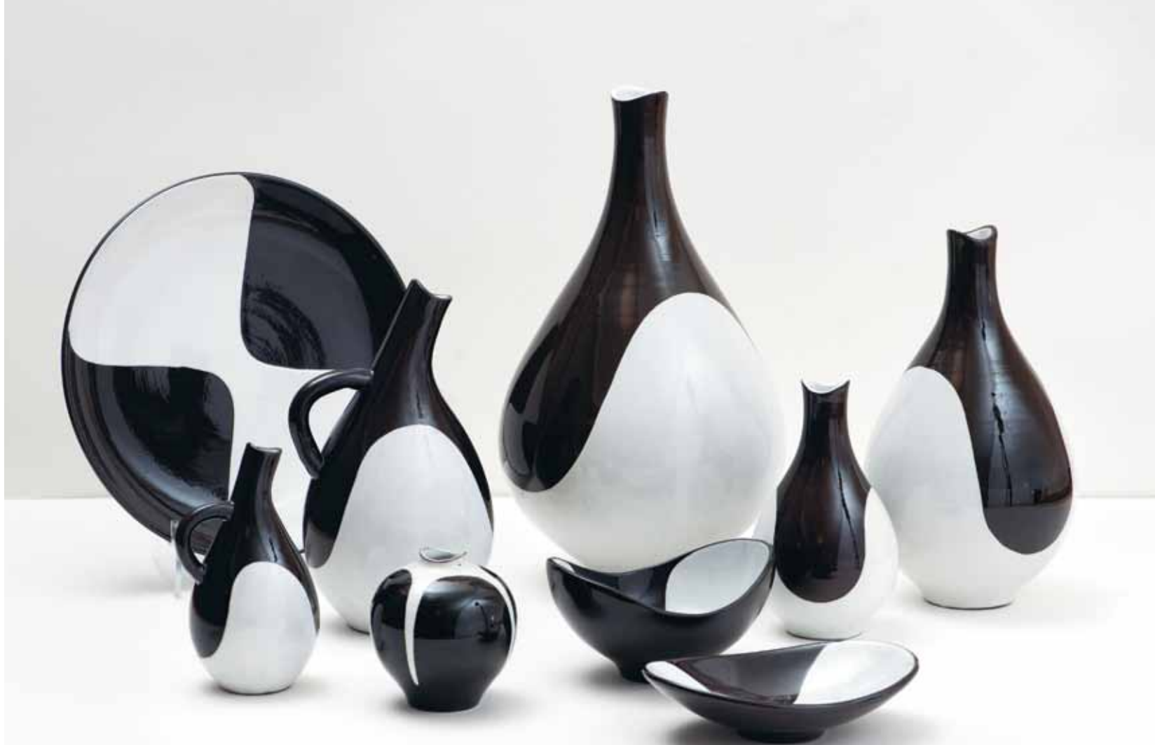
Pingvin , Upsala-Ekeby, 1954