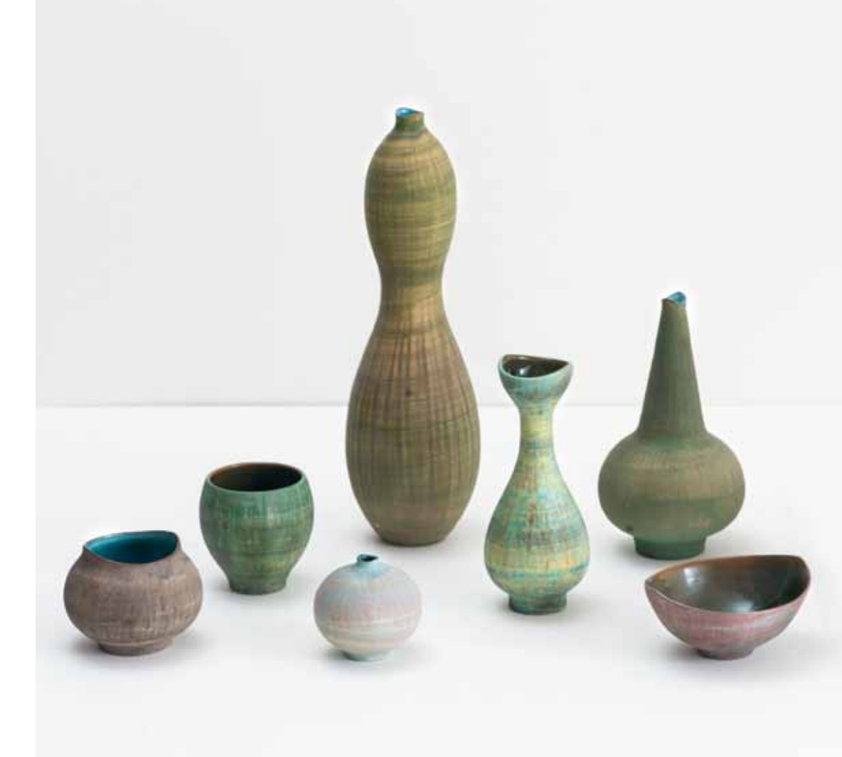
Till höger: Sakkara , Upsala-Ekeby, 1959-60