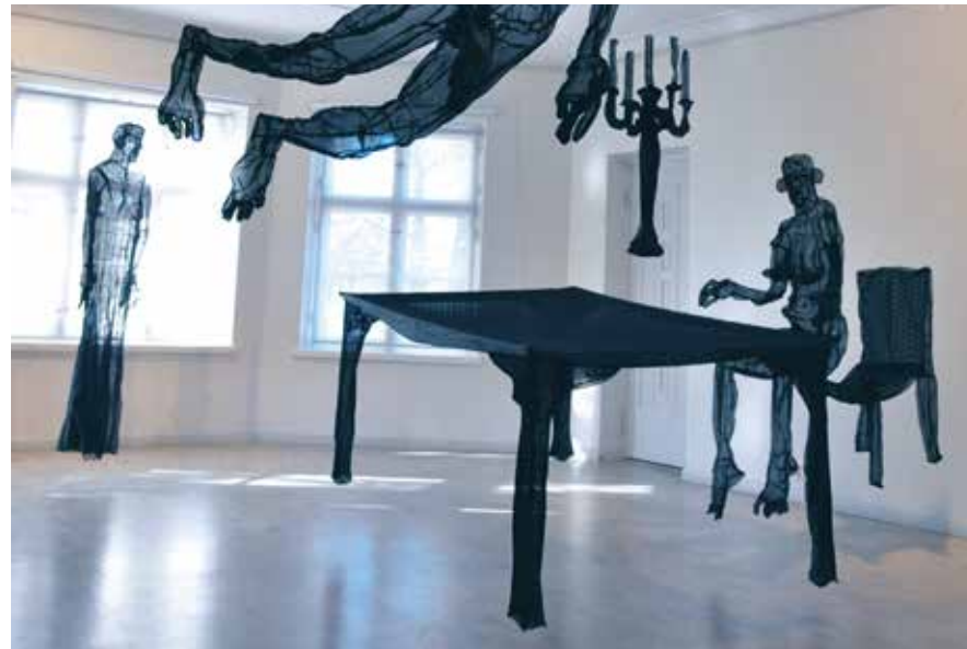
© Heli Ryhänen, Another Frequency , installation, 2010.