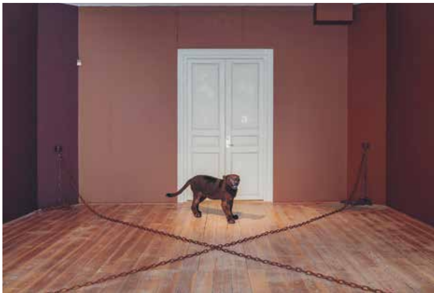
Hesselholdt & Mejlvang, bild från utställningen på konstmuseet.

I en omfattande installation närmar sig Hesselholdt & Mejlvang frågor om hur vi gärna vill förstå människor utifrån yttre parametrar såsom utseende, etnicitet, religion och kulturella uttryck. Konstnärerna har utgått från hudläkaren Thomas B. Fitzpatrick skala av olika hudtyper. Genom sex färgnyanser leds besökaren på en kulturhistorisk och populärkulturell vandring. Utställningen är en kritisk kommentar till eurocentrism, allmänna normer, fördomar och klichéer, och försöker skapa fördjupade och reflekterande perspektiv på etniska kategoriseringar i vårt samhälle.